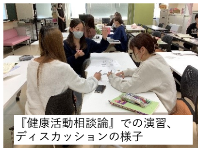
『健康活動相談論』での演習、 ディスカッションの様子