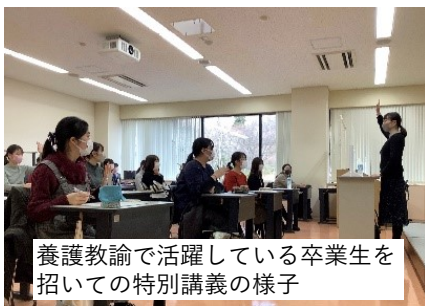
養護教諭で活躍している卒業生を 招いての特別講義の様子