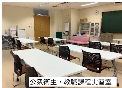
公衆衛生・教職課程実習室